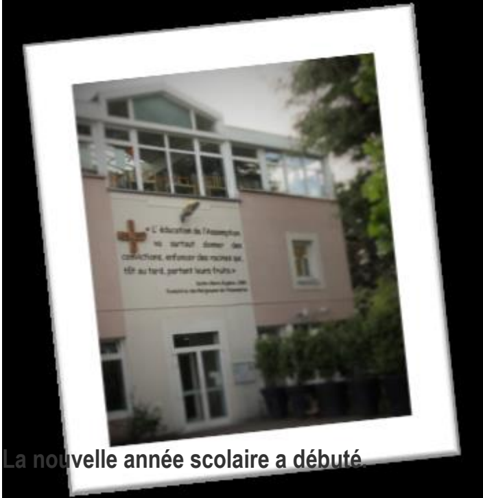
La nouvelle année scolaire a débuté

Nos enfants viennent de prendre ou de reprendre leur place à l'Assomption de BONDY. Notre association reprend également ses activités au service des familles, en liaison étroite avec la direction et la communauté éducative, pour le plus grand bien de l'éducation que nous voulons tous donner à nos enfants.